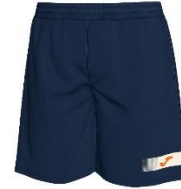
Short Réf.101343.361 (p.99)