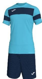
Set Academy II Réf. 101349.013 (p. 187)