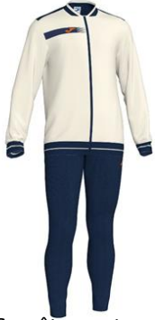
Survêtement Réf.101345.203 (p.100)