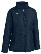
Calgary Réf.900922.331 (p.339)