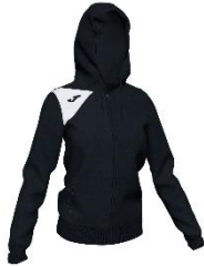
Maillot SPIKE II Réf. 900869.102 (p.298)