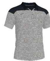
POLO MC WINNER II Réf. 101283.150 (p.209)