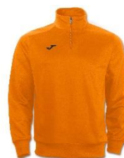
½ Zip Faraon Réf. 100285.050 (p.199)