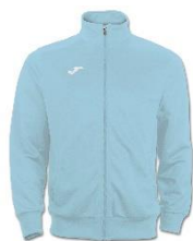
Gala Réf. 100086.110 (p.211)