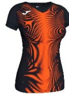
Maillot Réf.900933.120 (p.276)