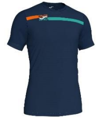
Tee-Shirt Réf.101347.331 (p.98)