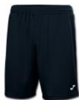
Nobel Réf. 100053.100 (p.50)