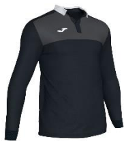
Polo ML WINNER II Réf. 101332.110 (p.211)