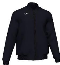
Bomber CERVINO Réf. 101293.100 (p.231)