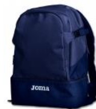
Sac à dos Estadio III Réf. 400234.331 (p.367)