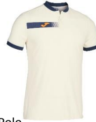
Polo Réf.101342.203 (p.97)