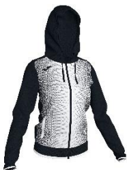
Supernova Réf. 900891.102 (p.290)