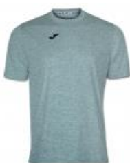
Combi Réf. 100052.250 (p. 193)