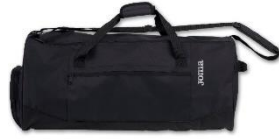
Travel bag Réf. 400236.100 (p.369)