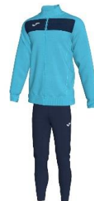
Survêtement II Réf. 101352..013 (p.189)