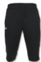
Pantacourt CAPRI Réf. 101101.100 (p.205)