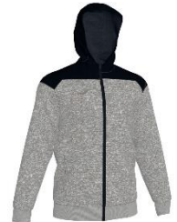
Sweat capuche WINNER II Réf. 101283.150 (p.210)